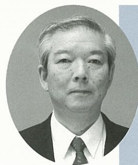
千葉市保健福祉局長