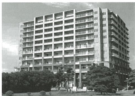
グッドタイムリビング 千葉みなと／海岸通 外観（土地・建物：賃借）

元気な方はより輝いて、 介護が必要になっても もうどこにも移り住むことなく 暮らし続けることができる “安心と賑わい”がここに。