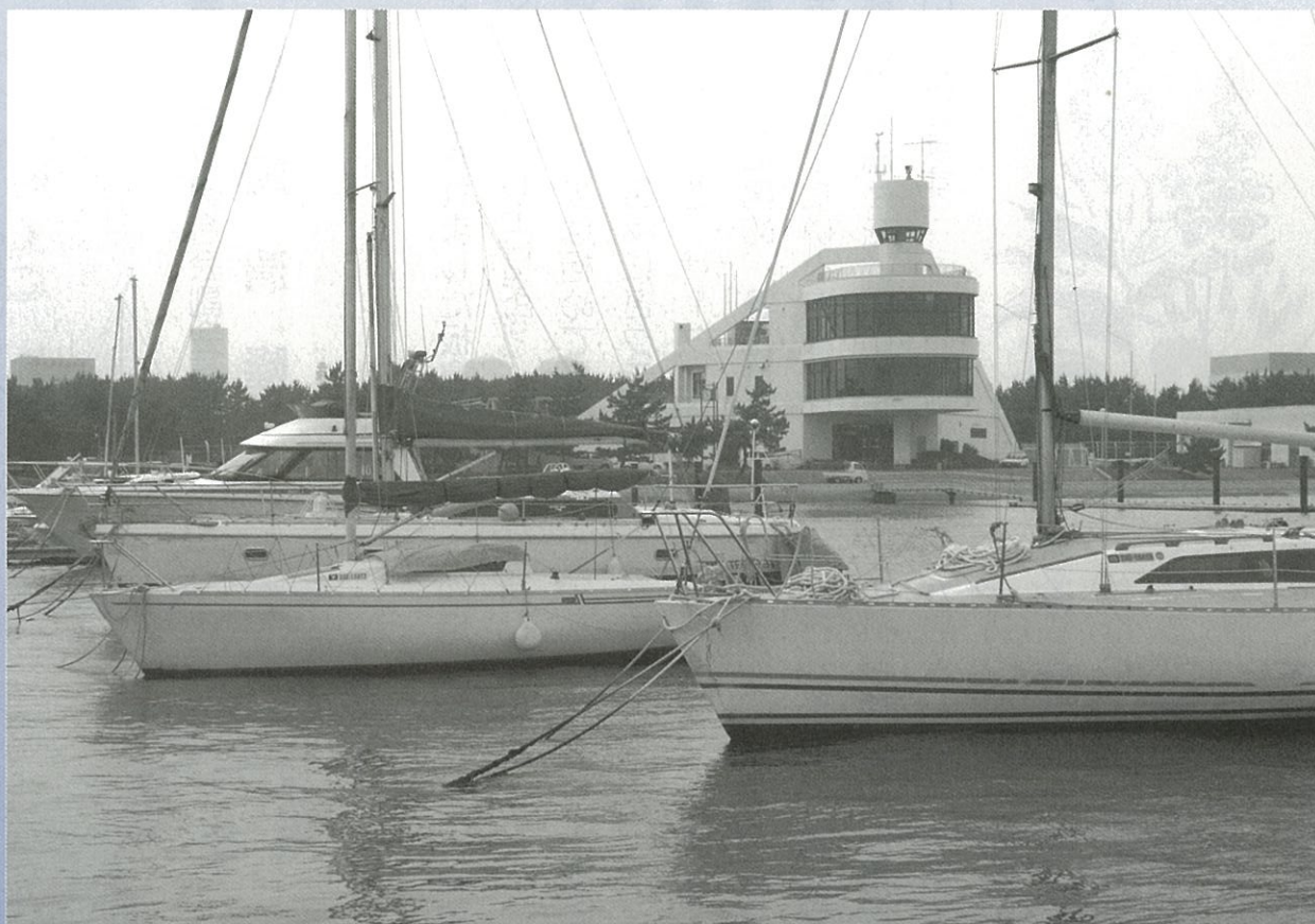
美浜区「稲毛ヨットハーバー」

発行：(社)千葉市老人クラブ連合会 千葉市中央区千葉寺町1208-2 千葉市ハーモニープラザ3F ☎043-262-1236