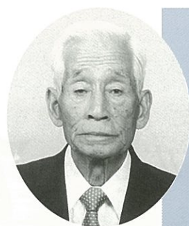
千葉市老人クラブ連合会副会長