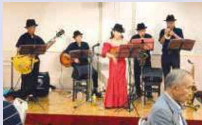
なぎさ懐メロ楽団 (地域の敬老会出演風景)

これらの活動が評価され、なぎさ会は、令和5年8月、「全国老人クラブ連合会」より『活動賞』を受賞しました。