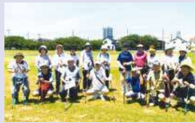
ノルディックウォーク (毎月第2・4月曜日)

中で仲間づくりや体力の維持・向上を図り、「健康寿命の延長」に取り組んでいます。また、懐メロ楽団・フラダンス・ウクレレのサークルは「千葉市ボランティア連絡協議会」に加盟し、千葉市ボランティアアセンタールからの紹介を含めて、高齢者施設やデイサービスなどで年間十数回演技を披露。