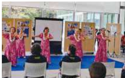
みつわ台柚子の会のフラダンス