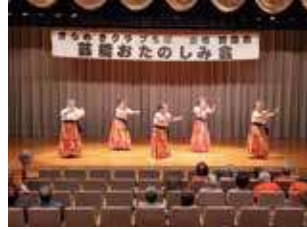
花見川区畑第一老人クラブのフラダンス