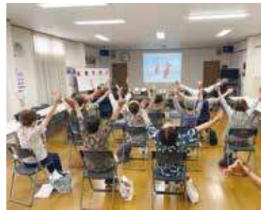
ビデオをみながら座ってできる いきいきクラブ体操

令和5年度からは、自立した活動として、隔月1回の活動で、60歳後半から90歳以上までと幅広い年齢層の方が20人程参加しています。