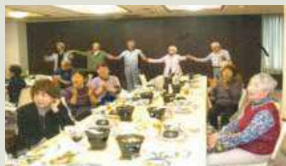
盛り上がる日帰りバス旅行

毎年人気のバス旅行、残念なことに3年間コロナの関係で中止となりました。楽しそうな皆さんの顔、顔。残念ながら4年間の空白は大きく、今回も中止に。今後は皆さんの笑顔がまた見られるよう、バス旅行を計画し実行できればと思っています。