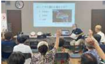
教養講座や脳トレは皆さん積極的に参加し発言します!!

座ってできる体操や脳トレ、教養講座、みんなで歌を歌うなど、毎回マンネリ化しないよう、工夫を凝らし誰が参加しても飽きることなく楽しめる憩いの場づくりを目指し取り組んでいます。