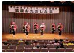
アンコールがあった中央区生実町百寿会の「南京玉すだれ」

令和5年11月21日（火）、千葉市ハーモニープラザにて女性委員会主催の「芸能おたのしみ会」を開催しました。24 演目、出演者延べ137名が参加。日頃の練習の成果を披露しました。