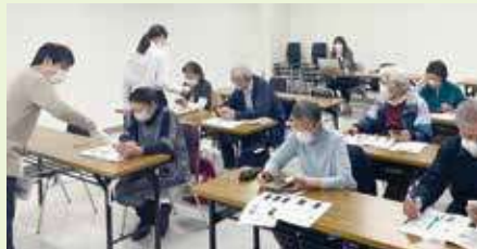
スマートフォン講座

今後、「デジタル機器に「興味がない・必要性を感じていない」と思っている方にも、利便性を知ってもらい、関心を持ってもらえるよう、他機関とも協力し、研修会やスマホ教室の開催、やってみたいと思えるスマホのアプリやSNSからの情報収集など、楽しく学び習得する場を提供していきたいと思えます。