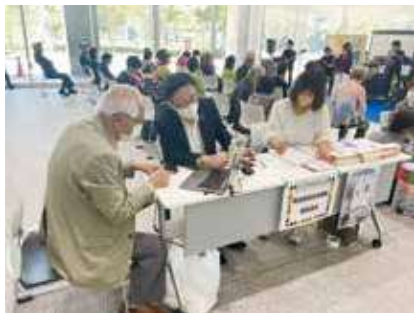
賛助会員相談コーナー

令和5年10月17日(火)、千葉市役所にて第2回千葉市シニアクラブフェアを開催しました。ステージで行われた活動発表は、前回より出場数も増え、老人クラブで練習してきた踊りや歌などを披露。賛助会員ブースの相談コーナーやeスポーツ体験コーナーなども引き続き設置しました。 また、当日は同会場で、千葉市内では初開催となるシニアによるeスポーツ交流大会も開催し、大変盛り上がりました。