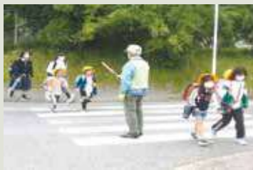
平山小学童見守り活動

毎年人気のバス旅行、残念なことに3年間コロナの関係で中止となりました。楽しそうな皆さんの顔、顔。残念ながら4年間の空白は大きく、今回も中止に。今後は皆さんの笑顔がまた見られるよう、バス旅行を計画し実行できればと思っています。