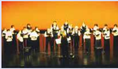
コーラス・うたごえなぎさ (芸能祭出演風景)