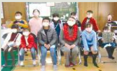
子どもたちとクリスマス会