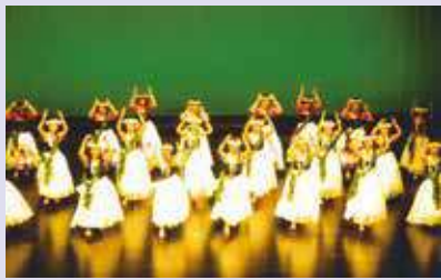
フラダンスサークル (芸能祭出演風景)

平成16年、磯辺三丁目西に居住するシニアを中心に、「磯辺三丁目西シニアクラブ」の名称で発足。自らの生活を豊かにする「サークル活動」と、高齢者が持つ時間と経験を活かし、地域を豊かにする「ボランティア活動」を開始。平成25年「なぎさ会」と改名。地域を限定せず、近隣町会のシニアの方々にも入会していただけるよう会則を改定し、会員増強と活動の充実を図りました。