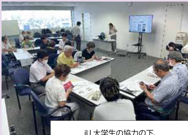
IU 大学生の協力の下、実施した発展編スマホ講習会の様子