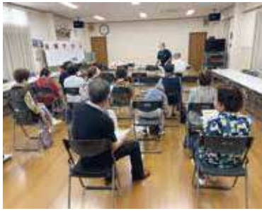
毎回 20 人前後の会員が参加

事務局のサポートの下、半年の活動の中で、役員みんなの協力もあって、今はゲーム機器の準備や設置やり方など、サポートなしでも行えるようになりました。