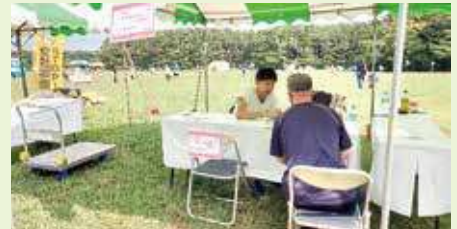
スマートフォン相談会