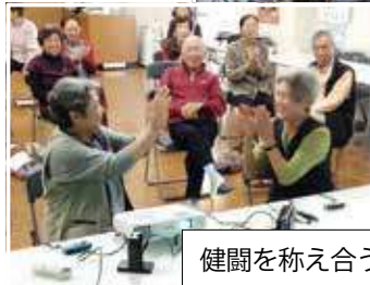
健闘を称え合うハイタッチ!!

今後は更なる高齢者の外出機会の創出や、多世代交流の場づくりを目指し、地域活性化に向けて、中央区生浜地区老人クラブのモデルサロンを基に、全区、地区、単位クラブにもみんなが集まれる通いの場づくりが拡大されることを期待しています。