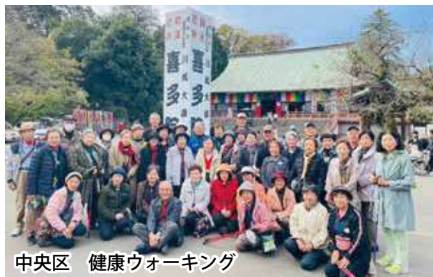
中央区 健康ウォーキング