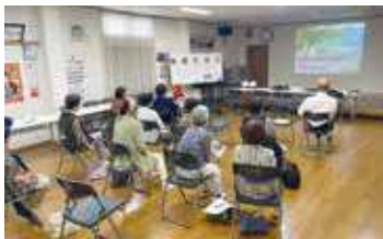
童謡から歌謡曲まで懐かしい歌をしつとりと歌いあげます

そしてなんととってもテレビゲームの時間が、一番エキサイトし笑いが絶えません。これを目当てに参加される方もいるほどです。