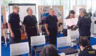
なぎさ懐メロ楽団『活動賞』受賞 (シニアクラブフェアにて表彰)

中で仲間づくりや体力の維持・向上を図り、「健康寿命の延長」に取り組んでいます。また、懐メロ楽団・フラダンス・ウクレレのサークルは「千葉市ボランティア連絡協議会」に加盟し、千葉市ボランティアアセンタールからの紹介を含めて、高齢者施設やデイサービスなどで年間十数回演技を披露。