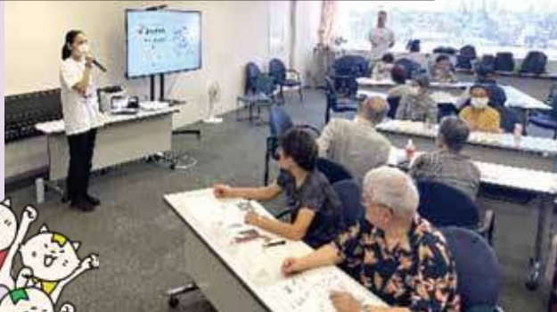
令和5年度に開催した墨田区老人クラブ連合会の会員を対象にした『みんなチャレ』講習会の様子

総務省では、デジタル化の恩恵を受けられる環境を整えるため、デジタル活用に不安のある高齢者に対し、「デジタル活用支援推進事業」に取り組み推進しています。そんな中、墨田区老人クラブ連合会で導入された事例を紹介します。