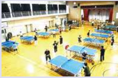
いきいき卓球 (毎週土曜日・小学校体育館)

現在活動中のサークルは「ゴルフ・ゴルフ」いきいき卓球「百歳体操」「いきいき太極拳」「ノルディックウォーク」「健康麻雀」「コーラス」「フラダンス」「ウクレレ」「懐メロ楽団」と数多く、会員はそれぞれ好きなサークルに所属し、趣味を楽しむ