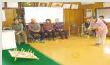
輪投げで楽しむ 定例サロン

輪投げでは0点が出ては笑い、300点が出ては大はしゃぎ、段々と熱を帯びてきます。