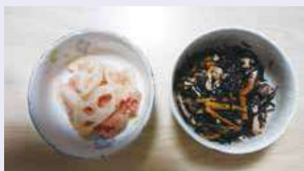
左) めんたい酢ばす 右) ヒジキ煮