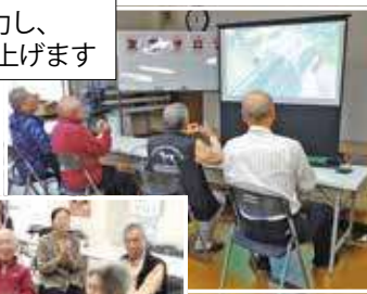
4人で協力し、 網で魚を釣り上げます

なかでも、仲間と協力して時間制限内に目標達成を目指すゲームや、息を合わせて同じ動作を行うゲームなどは、みんな真剣に取り組み、失敗しても笑い飛ばしてお互いの健闘を称え合いながら和気あいあいと楽しんでいます。